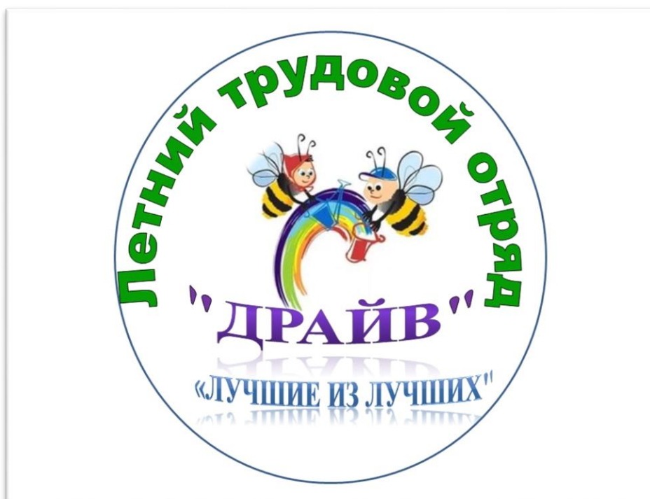
Эмблема отряда «Драйв»